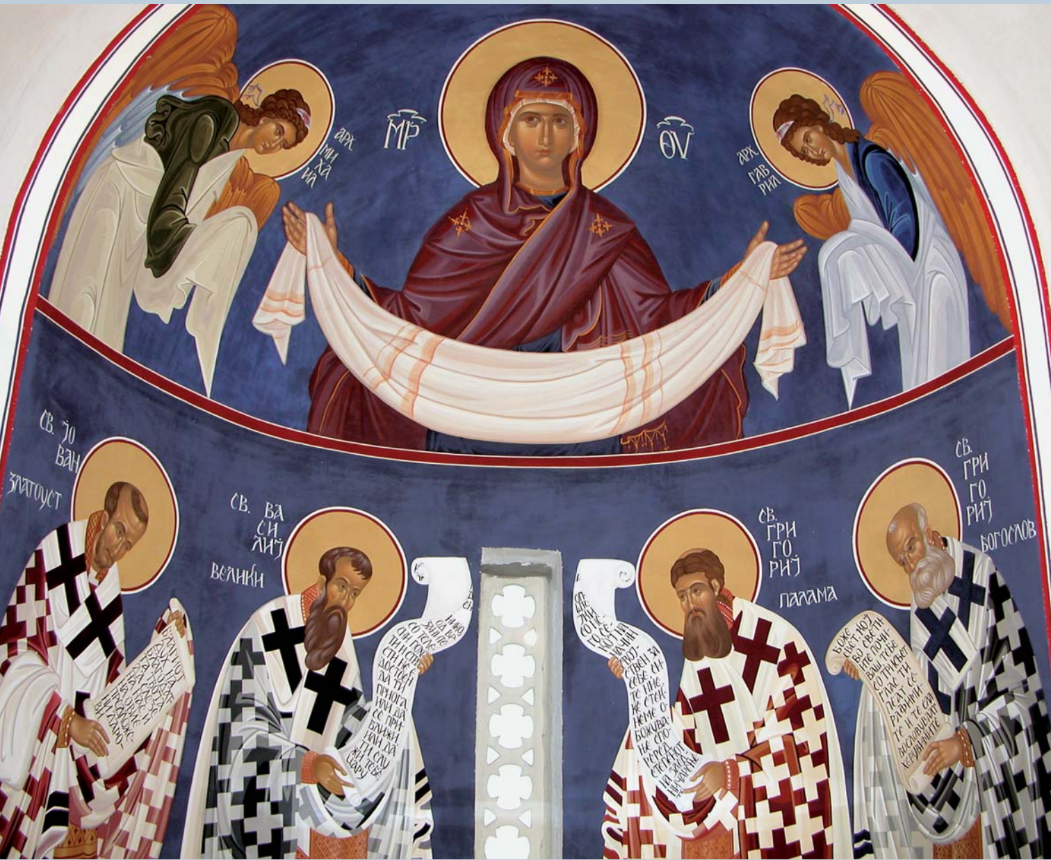
фрески во параклисот на Свети Григориј Палама во манастирот на Пресвета Богородица Елеуса во Велјуса